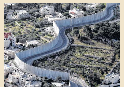
So sieht die Sperrmauer in der Nähe von Jerusalem aus.