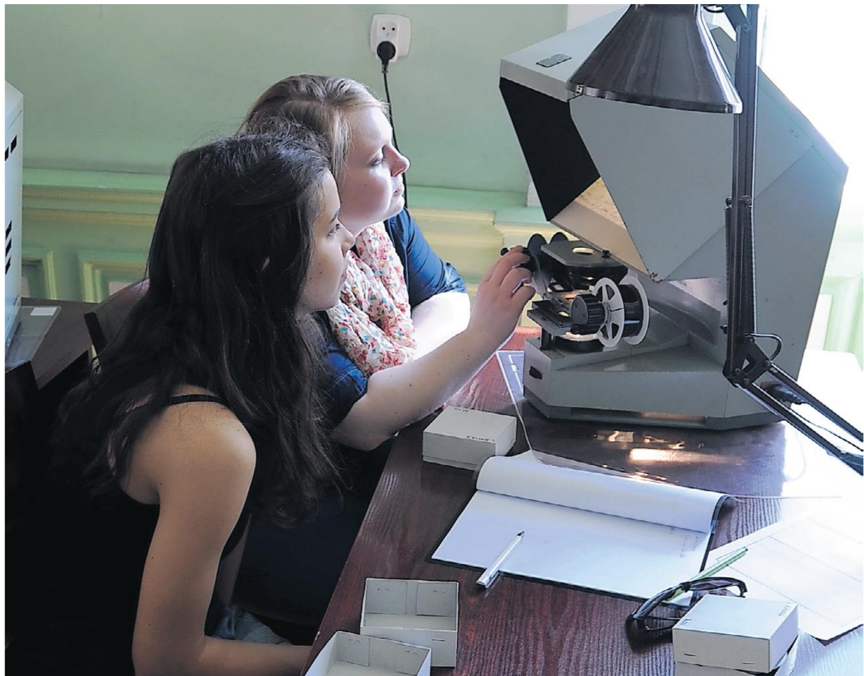
Im Staatsarchiv Lodz: Schüler betrachten die auf Mikrofilm festgehaltenen Postkarten.