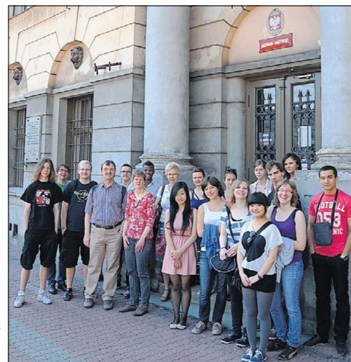
Die Emdener Gruppe vor dem Gebäude des Staatsarchives in der polnischen Stadt Lodz.

Während des Austauschprogramms fuhren wir unter anderem zum Bahnhof Radegast und zum jüdischen Friedhof. Wir gingen ins Archiv, um nach Spuren der Juden aus Emden zu suchen. An einem Tag begaben wir uns nach Chelmo, wo das Vernichtungslager war. Wir hatten auch gemeinsam Deutschunterricht. Polnische Schüler lasen deutsche Zungenbrecher und die Deutschen lernten polnische Sätze. Den Unterricht zu Stereotypen in den Verhaltensweisen der beiden Nationen fand ich sehr interessant. Eines Abends machten wir zusammen ein großes Lagerfeuer außerhalb der Stadt, wir aßen und spielten Volleyball. Den ganzen Austausch finde ich Klasse!